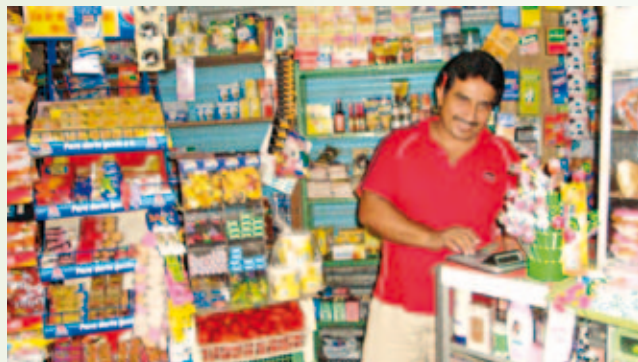
Maquinaria en labores con el PMB.

El monto de colocación en el 2010, fue superior en un 54% con respecto al 2009. En cuanto al número de créditos otorgados en el período que se informa,