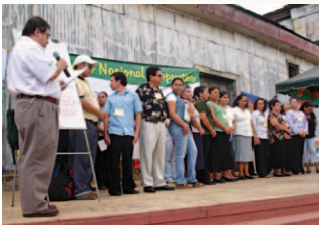
Juramentación de la FESCOVAM

También, ésta y la FESCOVAM han participado en diferentes eventos a nivel nacional e internacional, durante el año, como: El Foro Urbano Mundial de la Organización de las Naciones Unidas-Hábitat, el cual se celebró en marzo en la ciudad de Río de Janeiro, Brasil; Asamblea de constitución de la FESCOVAM llevada a cabo en la Plaza San Esteban en el mes de julio; Marcha de La Paz y Contra la Violencia, realizada en agosto, en el barrio San Jacinto, San Salvador;