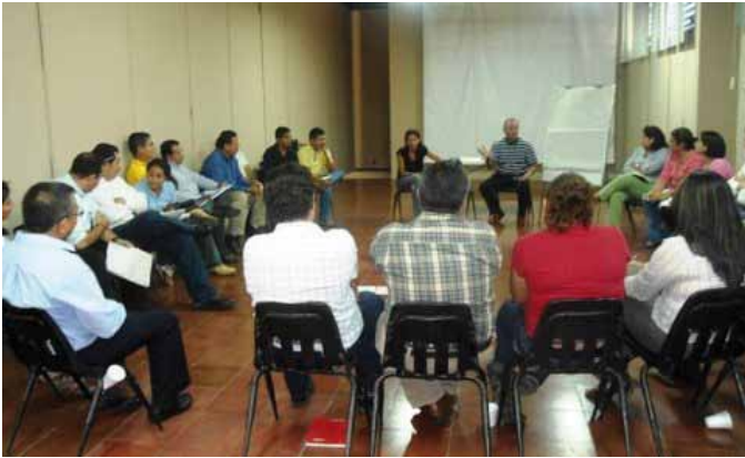
Reuniones con gobiernos locales.

La educación popular estuvo en el centro del análisis, debate y retroalimentación mutua entre dos instituciones de gran trayectoria en América Latina. Estas son: el Centro Memorial Martín Luther King de Cuba y FUNDASAL de El Salvador, quienes han puesto en práctica la educación popular durante 34 y 43 años, respectivamente. Debido a esa gran experiencia acumulada, ambas instituciones realizaron, del 10 al 24 de agosto, un enriquecedor ejercicio de intercambio sobre la metodología educativa empleada con la población meta de las dos organizaciones.