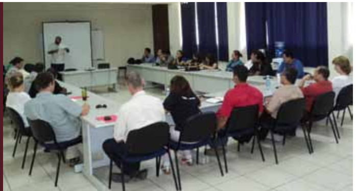
Reuniones con gobiernos locales.

de diversos municipios y con familias beneficiadas. Se recorrieron proyectos de mejoramiento de barrios y de reconstrucción; visitaron obras ejecutadas; participaron en talleres para conocer metodologías; tecnologías blandas y duras así como enfoques y dinámicas que se aplicaron a cada uno de los procesos. En cada lugar resaltó la disposición de la gente a transmitir sus cambios de vida luego de finalizada la intervención. Por su parte, FUNDASAL aportó su experiencia y conocimiento con el fin que los visitantes cumplieran sus expectativas. Fue visible el impacto causado en la delegación por los visto y vivido en cada proyecto y en diversas comunidades, quienes manifestaron sus impresiones por la magnitud, novedad y calidad en cada obra, proyecto o proceso observado y en especial, de los logros obtenidos por las familias.