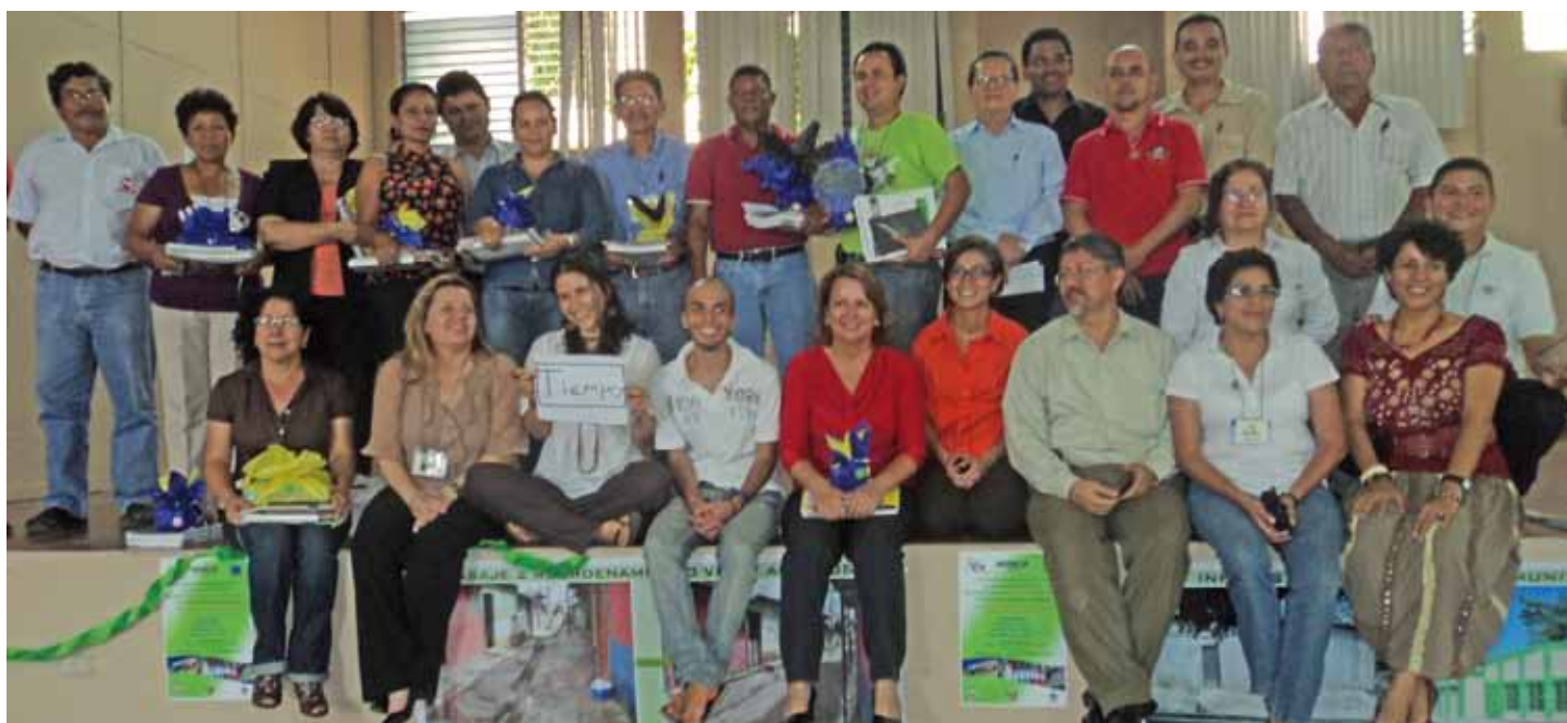
Las delegaciones de Guatemala, Honduras, Costa Rica, Nicaragua, Panamá, junto a la de El Salvador, durante la clausura del evento junto a personal de FUNDASAL y representantes de los gobiernos locales de los municipios de Soyapango, Ilopango y Mejicanos y Ciudad Delgado.