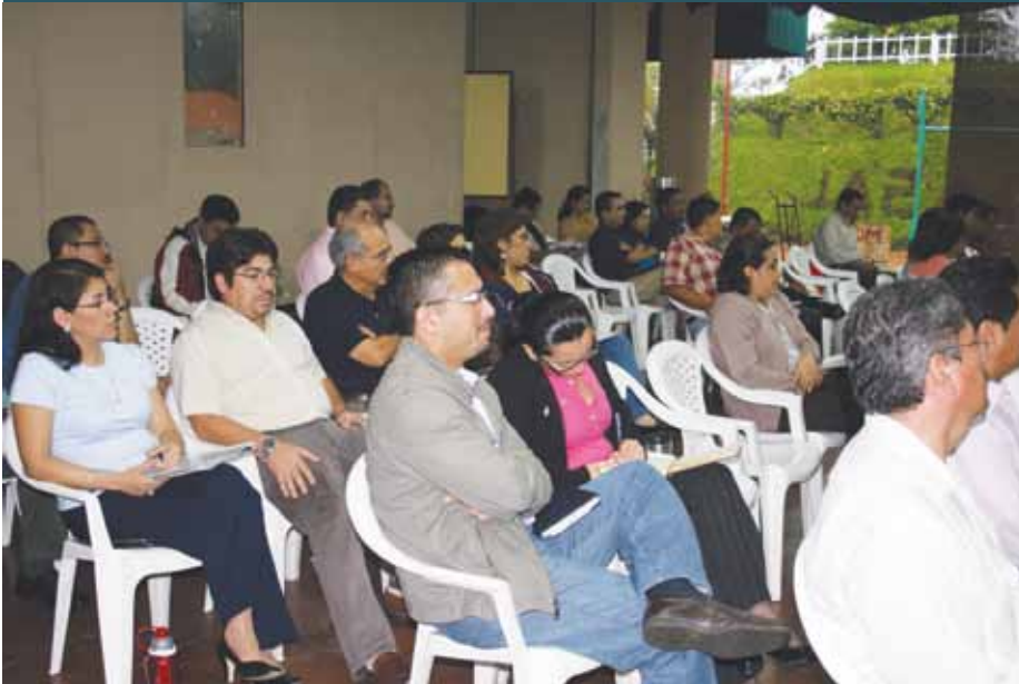
Personal de FUNDASAL en jornada de análisis de contextos.

El proceso de preparación para la planificación estratégica institucional para el quinquenio 2011-2015 de la Fundación Salvadoreña de Desarrollo y Vivienda Mínima (FUNDASAL) dio inicio el 28 de junio con el análisis del contexto en los temas político, económico y social. Se requiere partir del análisis de las dinámicas nacionales que tienen incidencia en el quehacer de FUNDASAL y sus posibles tendencias en los próximos cinco años con miras a prever riesgos o aprovechar oportunidades de acuerdo al quehacer institucional.