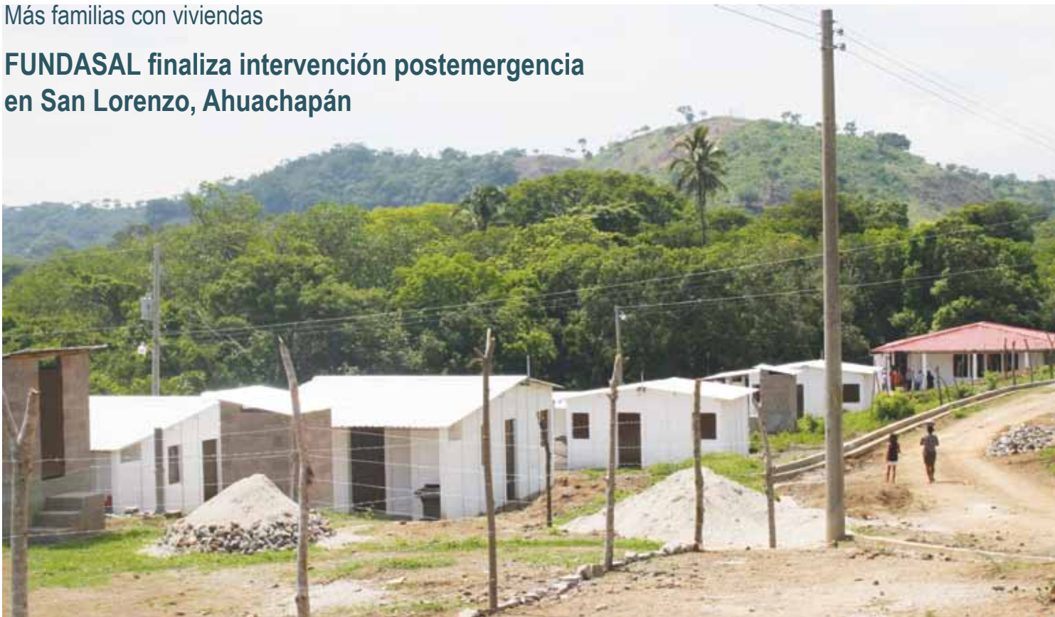
Vista parcial del asentamiento rural "San Lorenzo II".