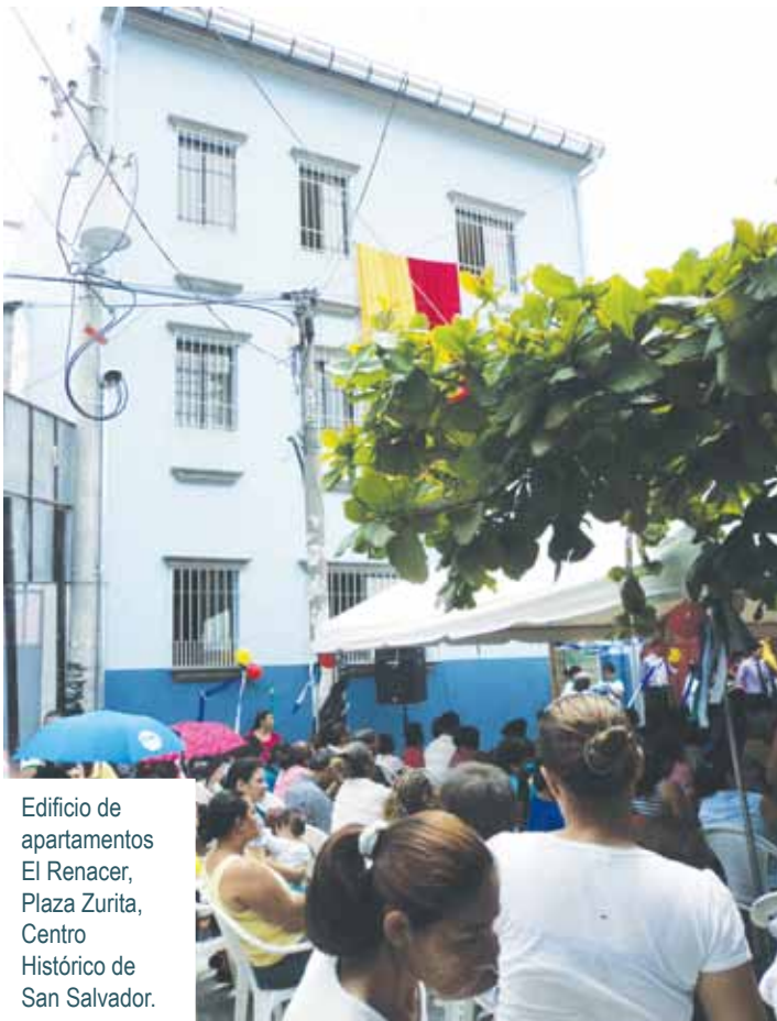
Edificio de apartamentos El Renacer, Plaza Zurita, Centro Histórico de San Salvador.

Luego de un proceso educativo desarrollado por FUNDASAL, hoy ven todo de forma diferente; ya no hay rivalidad ni egoísmo, lo han sustituido por la hermandad y solidaridad. Esos valores son parte de los frutos del cooperativismo de vivienda por ayuda mutua. Porque entendieron el mensaje; porque trabajaron duro junto a otras cooperativas... hoy cosechan los frutos.