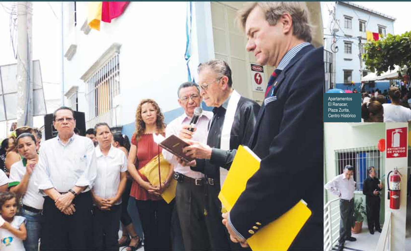
Apartamentos El Renacer, Plaza Zurita, Centro Histórico

Esos aportes, dirigidos a minimizar la pobreza y exclusión en que vive, lastimosamente, un buen porcentaje de la población salvadoreña, se ven en obras que ya están disfrutando las familias beneficiadas; obras de las cuales fueron parte en los procesos y por lo que en la actualidad gozan viviendo en mejores ambientes. No todo lo realizado por FUNDASAL junto a las instituciones cooperantes, alcaldías, instituciones estatales y la población misma es posible su cobertura. Esta publicación muestra sólo una parte de todo ese accionar desarrollado durante el segundo trimestre del año. Esperamos seguir con esa dinámica a favor de más salvadoreñas y salvadoreños.