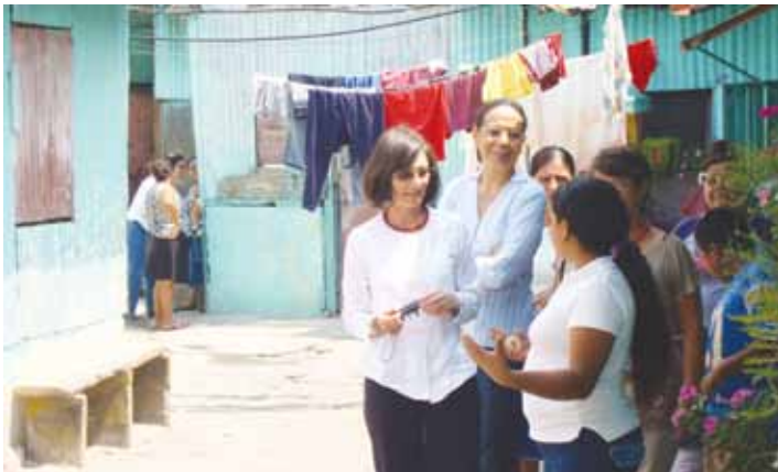
Hubo interacción en un ambiente muy cordial con las familias, en su mayoría madres solteras, quienes agradecieron tan grata visita.

El Código de Ética especifica, esclarece y enfatiza los principios y valores morales presentes en la diaria interacción entre las personas que laboran en la institución, en relación con el Estado, las entidades de cooperación externa, donantes nacionales, las comunidades y entidades privadas. Su contenido es un recordatorio permanente para que se conserven relaciones de justicia y solidaridad a todo nivel, actuar con honestidad, integridad, responsabilidad y respeto en toda ocasión. Sin embargo, el Código de Ética Institucional es también un legado orientador a las nuevas generaciones de colaboradores y colaboradoras de FUNDASAL. “Durante sus 41 años de trabajo, FUNDASAL ha construido una imagen fuerte de laboriosidad, eficacia, eficiencia, transparencia y compromiso social. Es competencia de quienes trabajamos en la institución preservar y mejorar esa imagen a través del cumplimiento de las pautas establecidas en este Código de Ética”, reza parte del documento institucional. Llevar a la práctica un código de ética implica grandes compromisos; FUNDASAL está lista para regirse por lo escrito en el instrumento ético.