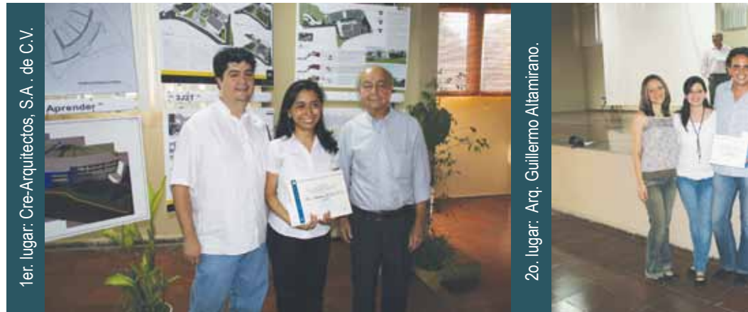
1er. lugar: Cre-Arquitectos, S.A. de C.V.