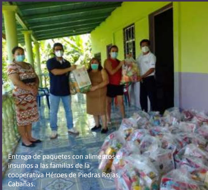
Entrega de paquetes con alimentos e insumos a las familias de la cooperativa Héroes de Piedras Rojas, Cabañas.