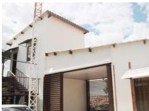
Hostal para peregrinos