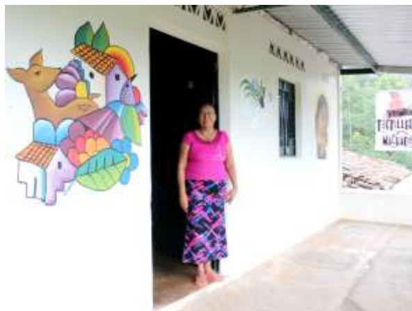
Vivienda mejorada para albergue de peregrinos