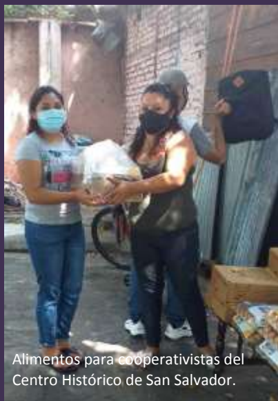
Alimentos para cooperativistas del Centro Histórico de San Salvador.