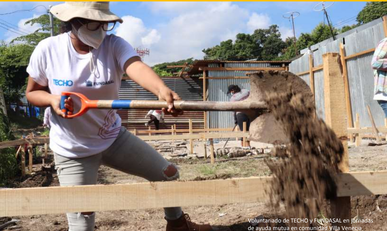
Voluntariado de TECHO y FUNDASAL en jornadas de ayuda mutua en comunidad Villa Venecia

Estos eventos evidencian la importancia de tener agua potable domiciliar, vivienda adecuada, alimentación sana, sistema de salud asequible, entornos amigables y seguros. También desnudaron la deuda histórica de la carencia de estos derechos humanos.