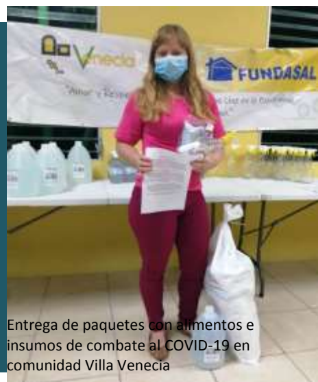
Entrega de paquetes con alimentos e insumos de combate al COVID-19 en comunidad Villa Venecia