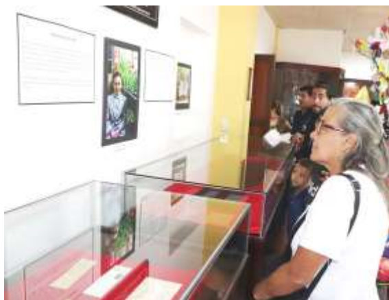
Sala de exposición del Museo San Óscar Arnulfo Romero