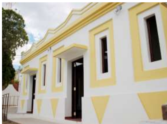
Museo San Óscar Arnulfo Romero