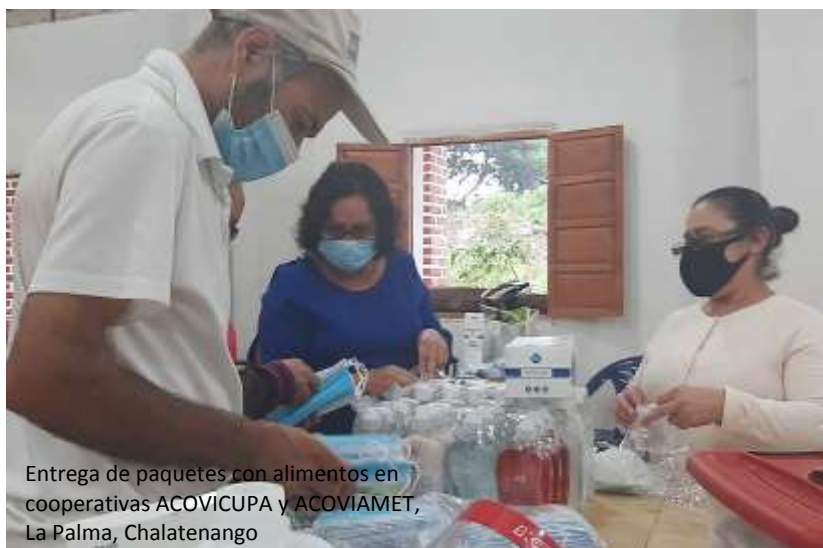
Entrega de paquetes con alimentos en cooperativas ACOVICUPA y ACOVIAMET, La Palma, Chalatenango

Estos aportes fueron fundamentales para las familias que, durante el confinamiento de cuatro meses, enfrentaron la pérdida de sus medios de subsistencia, alteraciones en su salud y el deterioro de sus viviendas. Acciones incondicionales de los profesionales de trabajo social del DPS.