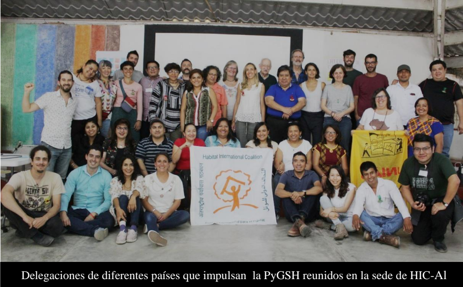
Delegaciones de diferentes países que impulsan la PyGSH reunidos en la sede de HIC-AL

16 países de América Latina (Argentina, Bolivia, Brasil, Chile, Colombia, Costa Rica, Ecuador, El Salvador, Guatemala, Honduras, México, Paraguay, Perú, Puerto Rico, Uruguay y Venezuela), y sus representantes de una diversidad de organizaciones, aliados e integrantes de la Coalición Internacional por el Hábitat en América Latina (HIC-AL), entre estas FUNDASAL, asistieron al 4° Encuentro Regional del Grupo de Trabajo de Producción y Gestión Social del Hábitat del HIC-AL, con sede en México.