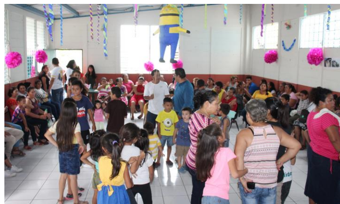
Foto superior, exposición de la experiencia de la Comunidad Villa Venecia; foto inferior, convivio comunitario.