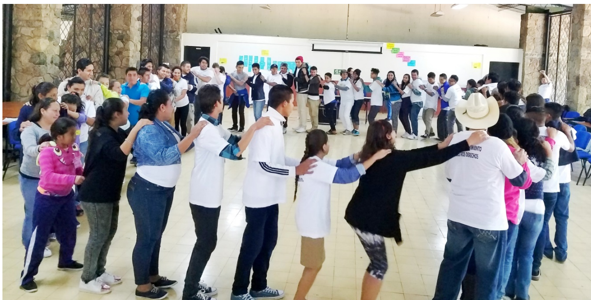
Dinámicas para fomentar convivencia, solidaridad y el respeto mutuo entre juventudes