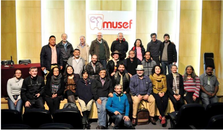
En la Ciudad de La Paz, Bolivia, la Red Iberoamericana de Arquitectura y Construcción con Tierra (PROTerra) con el apoyo de la Facultad de Arquitec-

tura, Artes, Diseño y Urbanismo de la Universidad Mayor de San Andrés y Casa de Tierra, realizaron el decimo-séptimo Seminario Iberoamericano de Construcción con Tierra (SIACOT 2017), bajo el lema "Tierra e Identidades", entre las fechas del 9 al 12 de octubre.