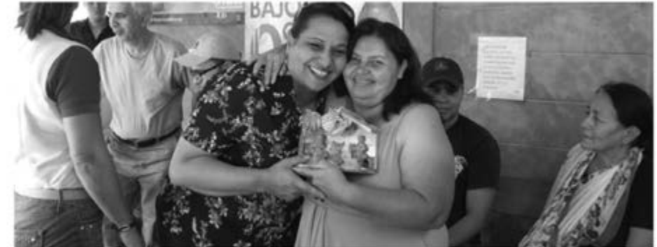
Pasante palestina y cooperativista asociada a Héroes de Piedras Rojas, cooperativa del área rural en etapa de convivencia, intercambiando momentos y vivencias.

Este tipo de esfuerzos, por lo tanto, y aunque demande sobrecargar el trabajo institucional ya planificado con