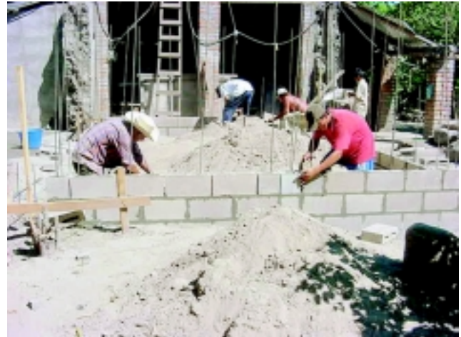
Los visitantes observaron diversas etapas de construcción de viviendas por parte de los propios beneficiarios.