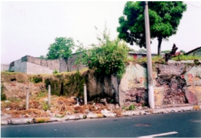
Predios baldíos como el de la imagen, son transformados y utilizados para parqueos, talleres o comercio informal.