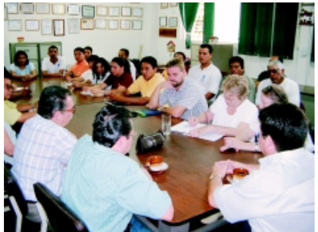
Reunión con el equipo de la Unidad Ejecutora La Paz, en ella se abordaron diferentes aspectos del programa de reconstrucción.