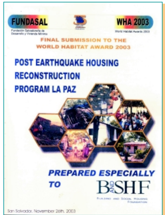
Portada del documento de la propuesta "Programa de Reconstrucción de Viviendas Pos-terremotos en la Paz" enviado a la sede del BSHF.