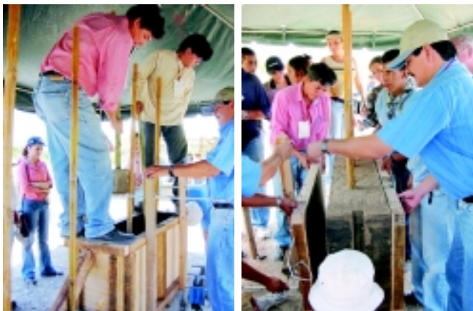
Participantes en los tecno-demos en plena jornada bajo la dirección de los expertos nacionales e internacionales en construcción con tierra.

El evento en mención se desarrolló los días 23 y 24 de septiembre del 2004 en el Auditorium ICAS de la Universidad Centroamericana José Simeón Cañas. El seminario se dividió en dos jornadas, en la cual el día 23 fueron las conferencias magistrales de los expertos provenientes de siete países de América Latina y