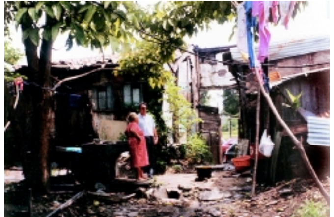
Muestra de uno de los tipos de vivienda localizada en el Centro Histórico de San Salvador.