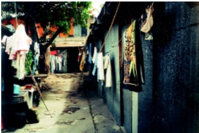
Vista panorámica al interior de un mesón.