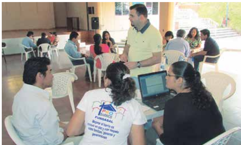
Análisis de la realidad sobre el fenómeno social de la violencia entre la juventud de los barrios populares.