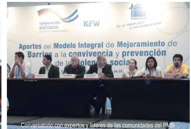
Conversatorio con expertos y líderes de las comunidades del PMB