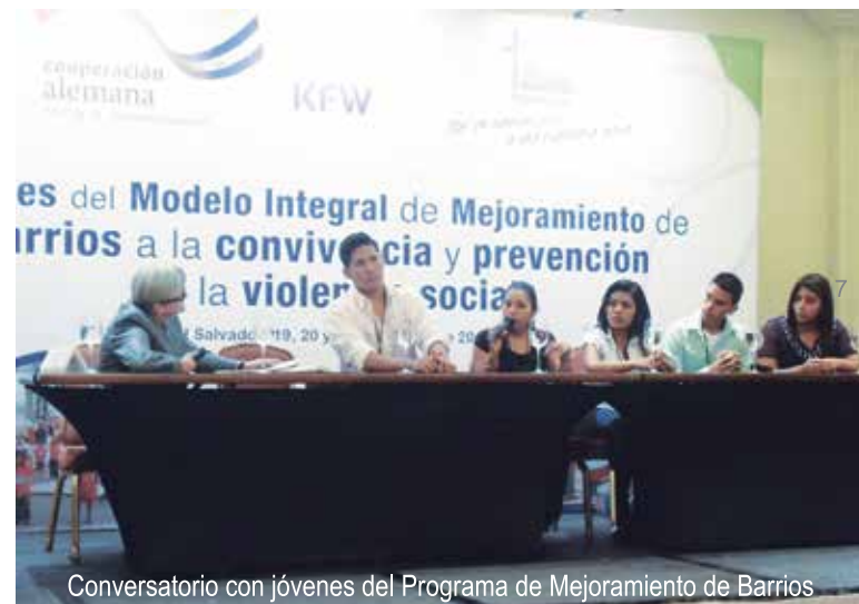
Conversatorio con jóvenes del Programa de Mejoramiento de Barrios