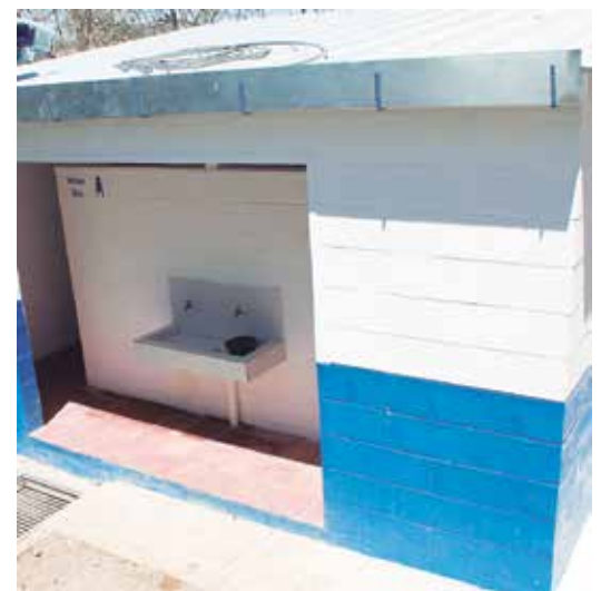
Vista general de la infraestructura física de la escuela