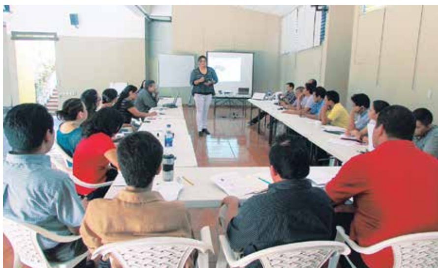
Personal en taller de técnicas audiovisuales

FUNDASAL continúa apostándole al constante aprendizaje de su personal en aspectos técnicos, académicos y metodológicos. En esta ocasión, técnicos y