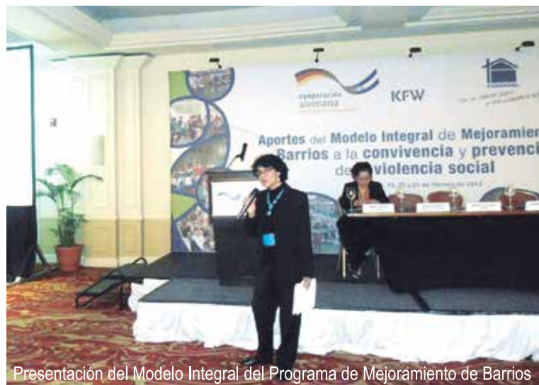
Presentación del Modelo Integral del Programa de Mejoramiento de Barrios

Durante el segundo día, las delegaciones en conjunto con representantes de las comunidades y FUNDASAL realizaron visitas in situ a proyectos localizados en los municipios de: San Salvador, Soyapango, Mejicanos e Ilopango, donde se realizaron recorridos por los barrios, constataron mejoras e interactuaron con familias y jóvenes de cada barrio visitado. Entre lo más sobresaliente del último día se realizó la presentación de resultados y conclusiones; Perspectivas desde la cooperación alemana: KfW-Programa CONVIVIR, GIZ-Programa PREVENIR. Conclusiones de los días 1 y 2 con elementos de debate para la aplicación desde políticas y programas del Gobierno central y local. Finalmente, se discutió el enfoque de mejoramiento de barrios y su aporte a la convivencia comunitaria desde políticas y programas del Estado con participación prevista de representantes del VMVDU, INJUVE y COMURES, retos y desafíos.