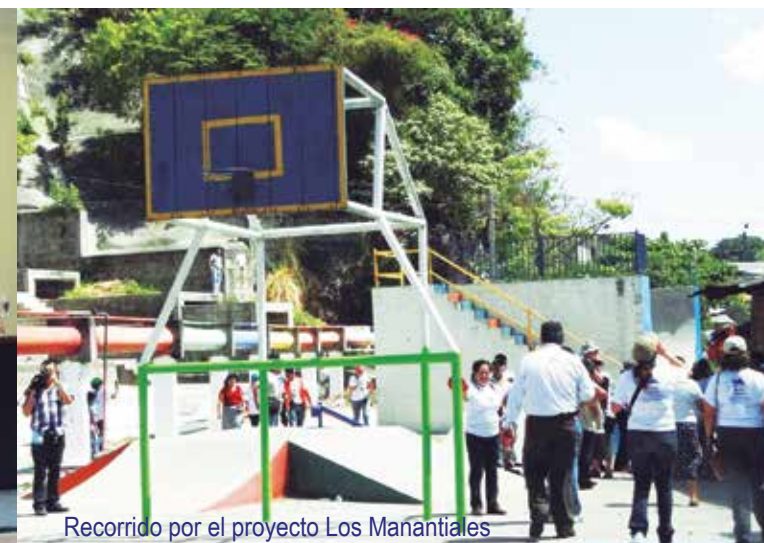
Recorrido por el proyecto Los Manantiales