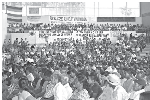
Encuentro de la Comisión Nacional de Pobladoras y Pobladores (CONAPO), representantes de comunidades y FUNDASAL, realizado el 31 de agosto de 2008, con una asistencia de 3 mil 500 personas, en el cual se acordó impulsar un proceso para crear una propuesta de Anteproyecto de Ley de Vivienda de Interés Social.

Todos estos esfuerzos realizados desde 1968, son el reflejo de una opción por los marginalizados y empobrecidos de El Salvador, que se ha traducido en el mejoramiento de las condiciones del hábitat buscando su sustentabilidad a través de una ciudadanía activa y corresponsable. Estas experiencias son referencia tanto a nivel nacional como internacional, en las cuales se ha aplicado la dimensión participativa, la ayuda mutua y el empoderamiento de los grupos poblacionales, permitiendo así la recuperación de su dignidad humana y la construcción de un tejido social con identidades colectivas, equitativas, justas y solidarias.