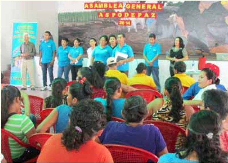
Presentación de la nueva Junta Directiva ante sus electores.

La Asociación de Pobladores del Departamento de La Paz (ASPODEPAZ) tienen nuevos integrantes. Esta organización que surgió del asesoramiento y acompañamiento de FUNDASAL hacia la población afectada por los terremotos de enero y febrero de 2001, ha desarrollado una interesante labor en pro de los intereses de miles de familias. Han consolidado un tejido social bien organizado con el protagonismo de hombres, mujeres y jóvenes de los diversos municipios. Cada Junta Directiva va dejando su aporte positivo a la reciente historia de ASPODEPAZ en la Región La Paz.