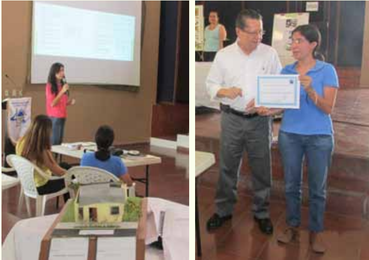
Imagen 1: Estudiantes en plena exposición. Imagen 2: entrega de diploma de participación a una de las futuras arquitectas.

FUNDASAL ha tomado en serio la tarea de apoyar el desarrollo de futuros profesionales en ingeniería, arquitectura, sociología y demás carreras académicas. En ese sentido, el pasado dos de abril se realizó una jornada de socialización de trabajos académicos, cuyos protagonistas fueron jóvenes universitarios quienes expusieron sus