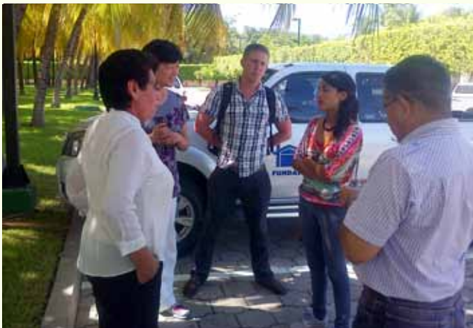
Acompañamiento a los representantes de la universidad inglesa durante el recorrido al proyecto de reconstrucción en La Paz.

Los resultados la ejecución de diferentes proyectos por FUNDASAL siguen generando interés en instituciones nacionales y del exterior. Algunos de éstos han sido galardonados en concursos mundiales. Durante el año se han realizado visitas guiadas a representantes de instituciones públicas y privadas así como una diversidad de actores interesados en conocer dichas experiencias.