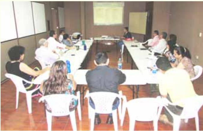
Titulares de diferentes instancias de FUNDASAL en pleno desarrollo del taller

La finalización del Programa de Mejoramiento de Barrios (PMB), por su alcance y complejidad, requiere de los aportes desde los mismos involucrados para conocer los resultados en aspectos como: Infraestructura y entorno; Mejora en la calidad de las viviendas; Cooperación institucional e Incidencia en las políticas públicas. Los resultados serán parte del documento final de sistematización del proyecto.