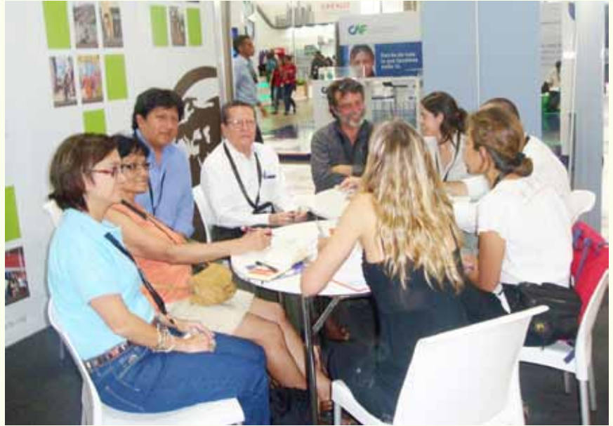
La Dirección Ejecutiva de FUNDASAL participa en uno de los talleres enmarcados en el WUF7.

En la ciudad de Medellín, Colombia, el Programa de las Naciones Unidas para los Asentamientos Humanos (UN-HABITAT) celebró su VII Foro Urbano Mundial (WUF7) con el lema “Equidad Urbana en el Desarrollo, Ciudades para la Vida”.