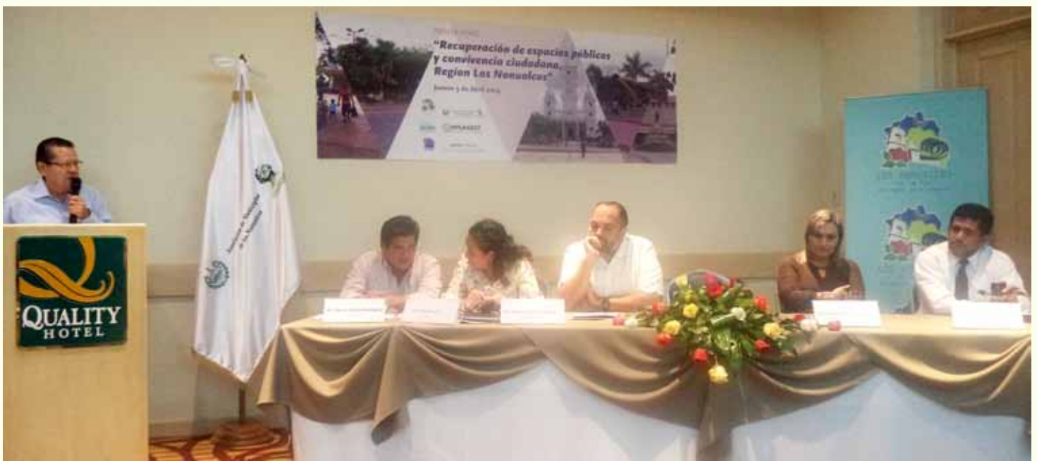
El Director Ejecutivo de FUNDASAL se dirige a la mesa principal durante el foro sobre recuperación de espacios públicos