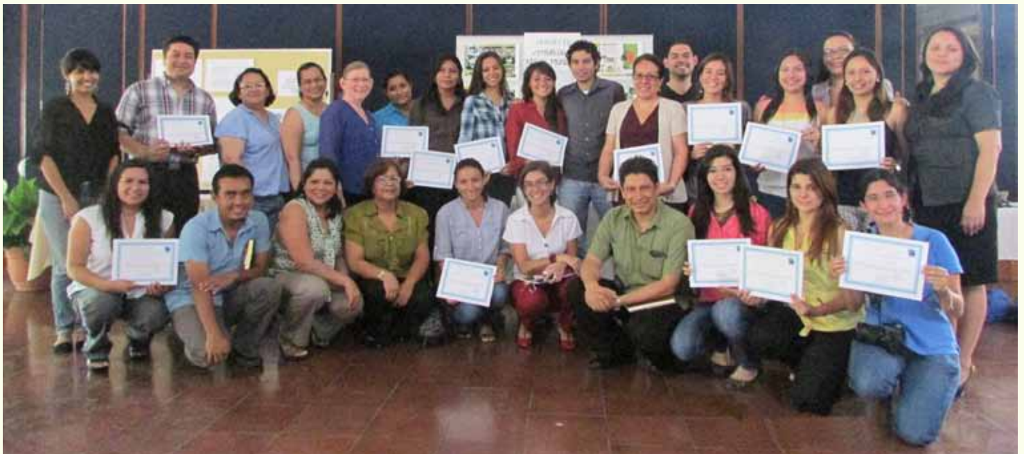
Estudiantes de la UCA y UES posan con sus diplomas de participación junto a sus coordinadores de carreras y personal de FUNDASAL