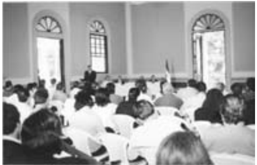
Acto de constitución de la Mesa Interinstitucional por el Rescate del Centro Histórico de San Salvador. 5 de mayo de 2005.